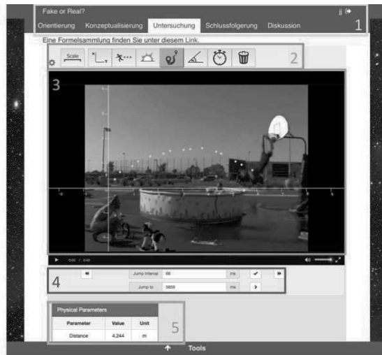
Abb. 1: Komponenten des Videoanalyse-Labs, eingebettet im ILS.

Die erfasste Flugbahn, sowie die daraus ableitbaren Parameter wie die horizontale und vertikale Geschwindigkeit bzw. Beschleunigung, können von den Lernenden analysiert werden. Um ihnen die Analyse zu erleichtern, ist eine visuelle Repräsentation der Daten sinnvoll. Aufgrund von Interoperabilität zwischen den Apps kann beispielsweise der Data Viewer , eine Go-Lab Inquiry App, kinematische Graphen darstellen (siehe Abb. 2). Beobachtungen während der Datensammlung und -analyse können mit dem Observation-Tool festgehalten werden. Erstellte Hypothesen, Beobachtungen und Graphen können dabei im Conclusion-Tool zu einer Schlussfolgerung aggregiert werden. Das Szenario endet damit, dass die Schüler ihr Vorgehen und ihre Ergebnisse zusammenfassen, kritisch reflektieren und die Ergebnisse in der Klasse diskutieren ( Discussion ).